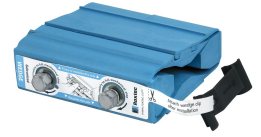
Wedge en Wedgekit

Ga naar roxtec.com voor uitgebreide informatie.